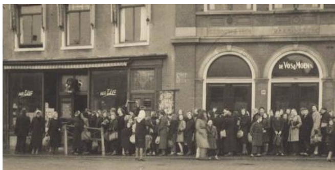
In de rij voor eten tijdens de oorlog

Toen bleek dat er niet minder, maar steeds meer voedselbanken bij kwamen, werd al snel geoordeeld over het gedrag van de voedselbankgangers. “Er zijn toch allerlei uitkeringen? Niemand hoeft in Nederland honger te lijden. Ze zullen het wel aan zichzelf te danken hebben. Eigen schuld.” En ja, er zijn klanten die niet direct handige keuzes hebben gemaakt in hun leven en die daardoor torenhoge schulden hebben. Soms bewust, soms onbewust. Maar wij hebben óók klanten die opeens in enorme financiële problemen komen, alleen maar omdat het ze is overkomen. ▶